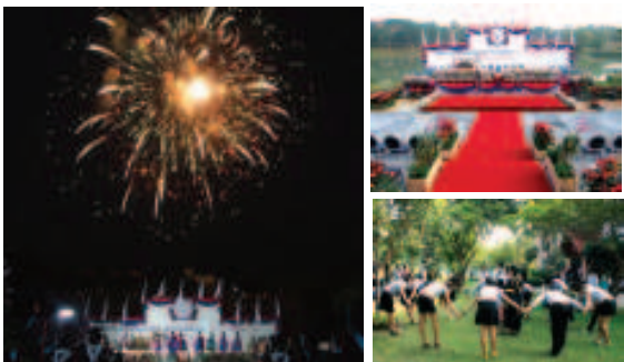
▲ มหาวิทยาลัยโยนก ขอขอบคุณชาวมหาวิทยาลัยโยนทุกคนที่ร่วมมือร่วมใจกันในการเป็นเจ้าภาพในการจัดงานประเพณีปริญญามุัตรประจำปีการศึกษา 2551 จนทำให้งานสำเร็จลุล่วงไปด้วยดี ท่ามกลางบรรยากาศพิเศษในสถานที่จัดแห่งใหม่