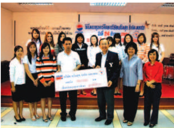
▲ มูลนิธิโยนก ได้มอบทุนการศึกษาให้กับนักศึกษาของมหาวิทยาลัยโยนก โดยเป็นกิจกรรมที่มูลนิธิจัดทำอย่างต่อเนื่อง