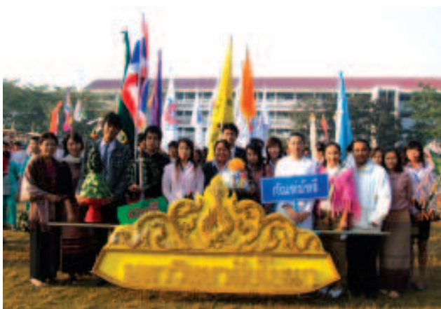
▲ อาจารย์ เจ้าหน้าที่ และนักศึกษาของมหาวิทยาลัยได้เข้าร่วมพิธีเปิดงานบุญตั้งธรรมหลวงเวียงละกอน ครั้งที่ 6 โดยได้นำกัณฑ์ธรรม์ไตรปิฎกธรรม์ ณ ลานมณฑปหลวงพอลดาศาลเจ้าพ่อหลักเมือง จังหวัดลำปาง