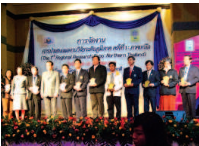
▲ มหาวิทยาลัยโยนก ได้รับเกียรติจากสภาวิจัยแห่งชาติ เข้าร่วมการนำเสนอผลงานวิจัยระดับภูมิภาค ครั้งที่ 1 (ภาคเหนือ) โดยถือเป็นมหาวิทยาลัยเอกชนแห่งเดียวของภาคเหนือที่ได้รับเชิญไปร่วม ซึ่งมหาวิทยาลัยได้นำเสนอแบบจำลองการพัฒนาถนนดววงรัตน ให้เป็นถนนธุรกิจและการท่องเที่ยวด้วย